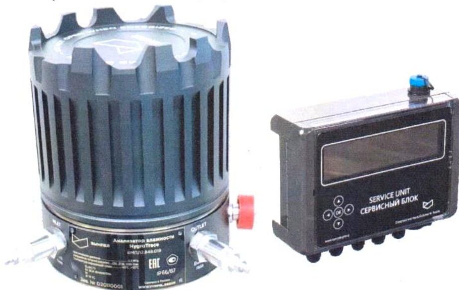
Рисунок 4 – Внешний вид сервисного блока исполнения NT