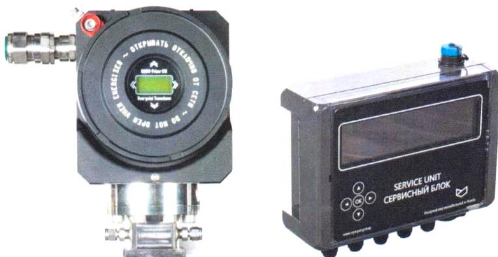
Рисунок 2 – Внешний вид сервисного блока исполнения 2М