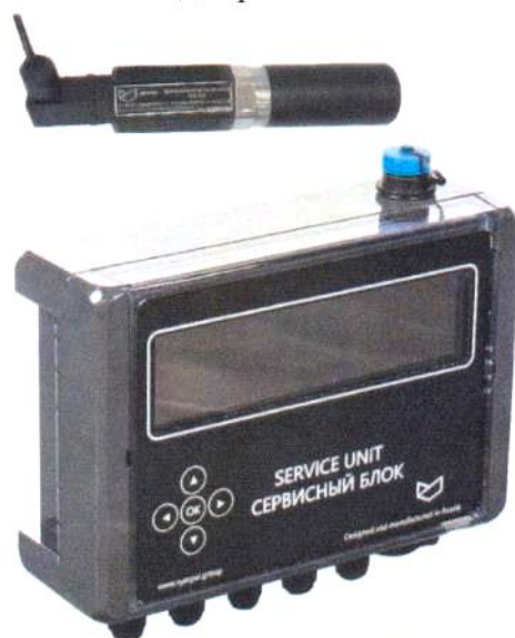
Рисунок 3 – Внешний вид сервисного блока исполнения SW