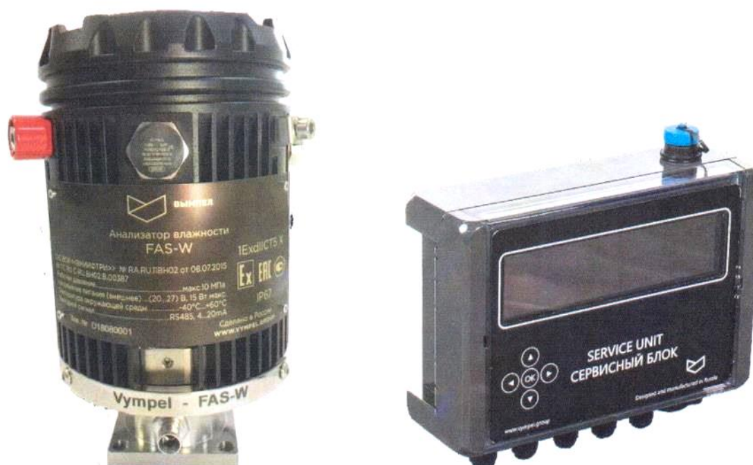
Рисунок 1 – Внешний вид сервисного блока исполнения W

Внешний вид сервисного блока в зависимости от исполнения приведен на рис. 1-4. Заводской номер наносится на табличку сервисного блока, прикрепленную на боковой поверхности корпуса вторичного блока, методом лазерной гравировки.